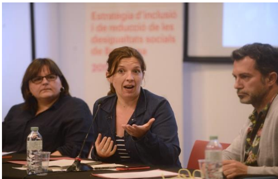
Laia Ortiz. Tinenta d'Alcalde de Drets Socials i Presidenta de l'Acord Ciutadà.

Es va agrair la feina de les organitzacions, la seva participació als diversos espais de l'Acord i la implicació en l'elaboració de l'Estratègia d'Inclusió i de reducció de les desigualtats socials 2017-2027, presentada el 9 d'abril.