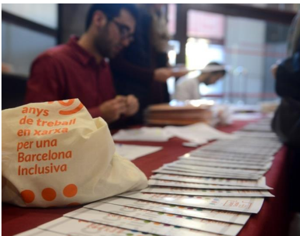
Valoració Assemblea 2017